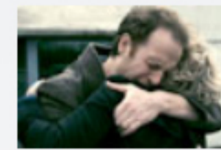
13 Filme zur Lage der Nation