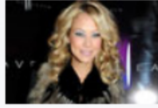
Sandy heizt als DJane ein