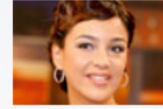
Unruhe in Veronas Welt