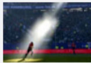
Die Bilder des Jahres 2008